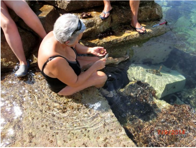
Eine sizilianische Familie beim suchen von Meeresfrüchten für ein leckeres Mittagessen zu dem wir eingeladen wurden