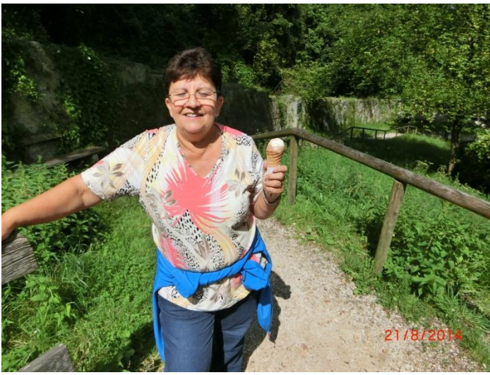
vor dem Aufstieg gab es auch eine klein eisige Stärkung.

Auch dies gab es auf unserem Wanderweg zu sehen.