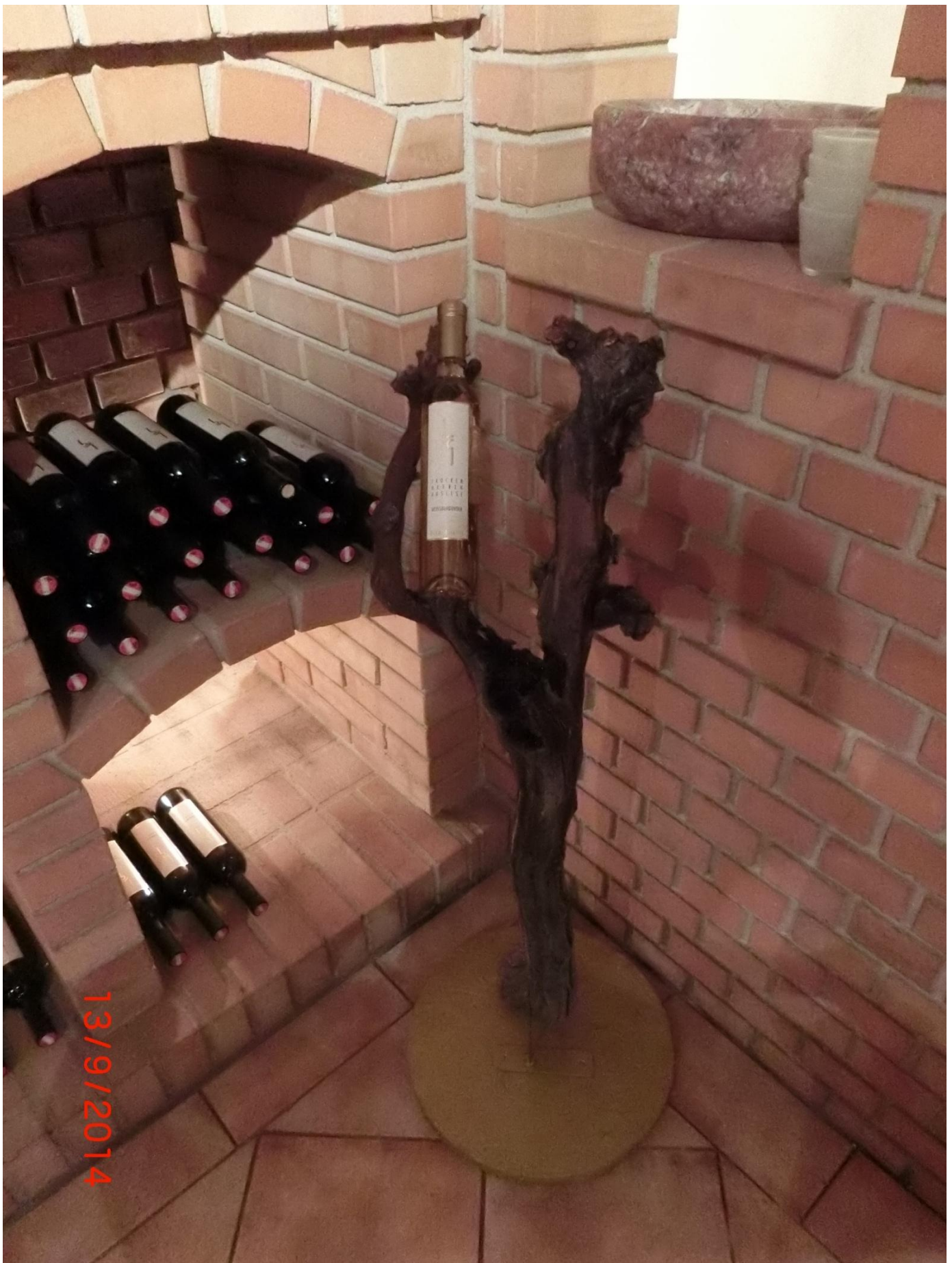
Und schon ging die Reise weiter nach: aber seht selbst: