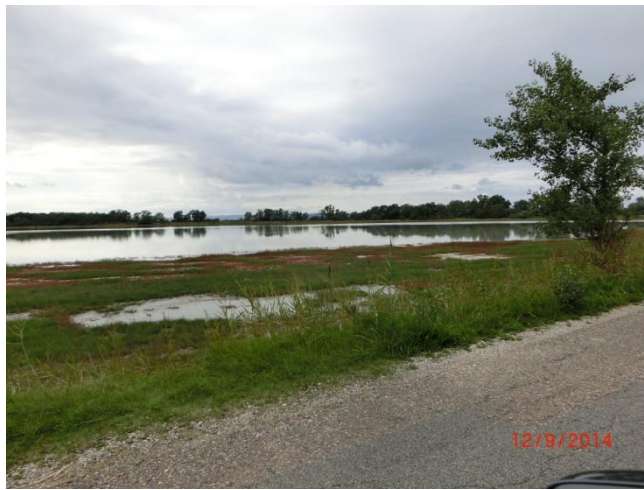
Am Neusiedler See →