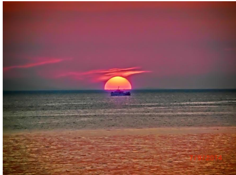
Das war ein besonders schöner und erlebnisreicher Tag!